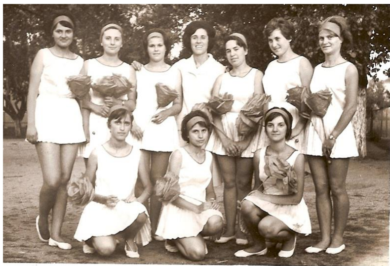
Лятото след 8 клас на стадион "Васил Левски", 1964 г.