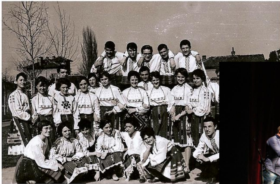
Г клас като участници в битовата 1964 г.

През 2006 г. с проекта „Магията на Мелпомена „ Първа АЕГ получава Сертификат за образцова инициатива за насърчаване на чуждоезиковото обучение.