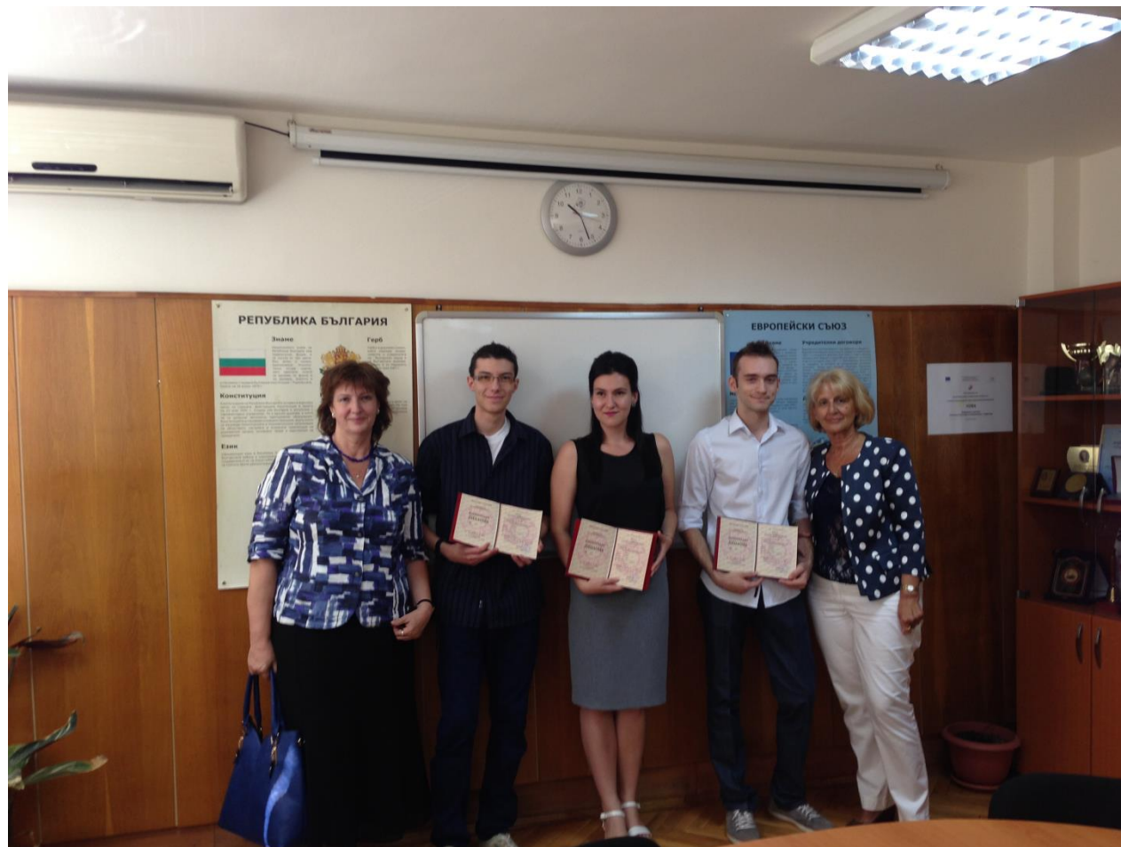
Връчване на Национални дипломи 2015г.